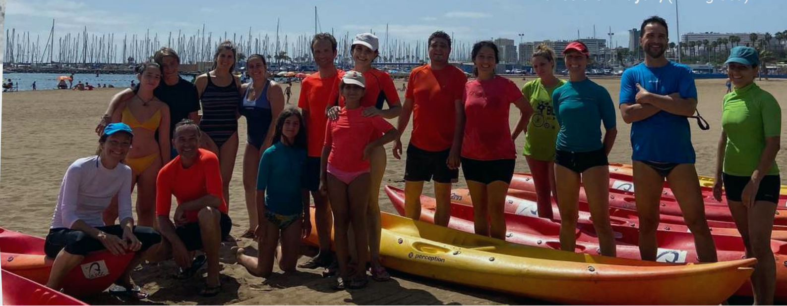
Travesía en Kayak, (Living Sea)