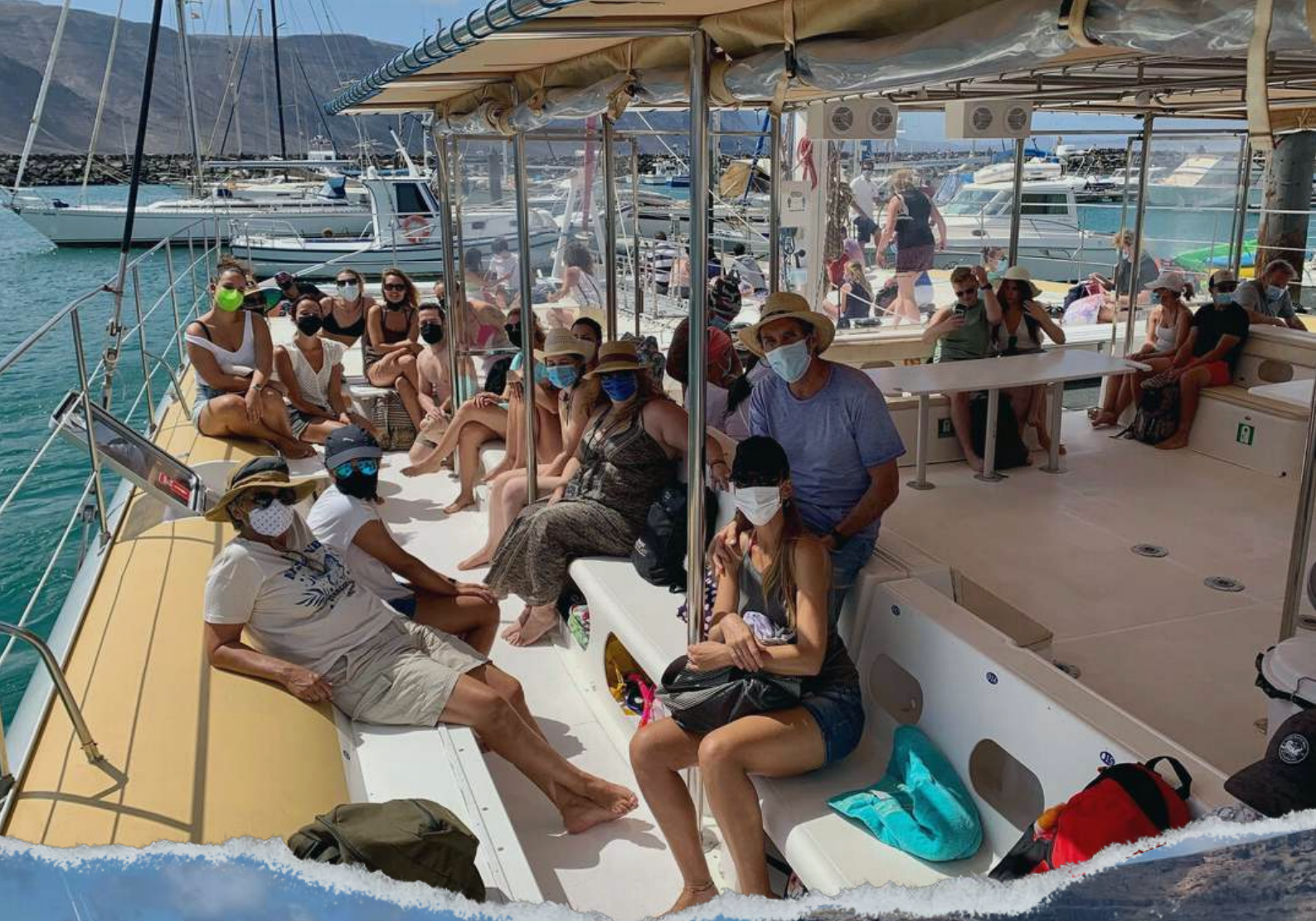
La Graciosa Sail, (Biosfera express)