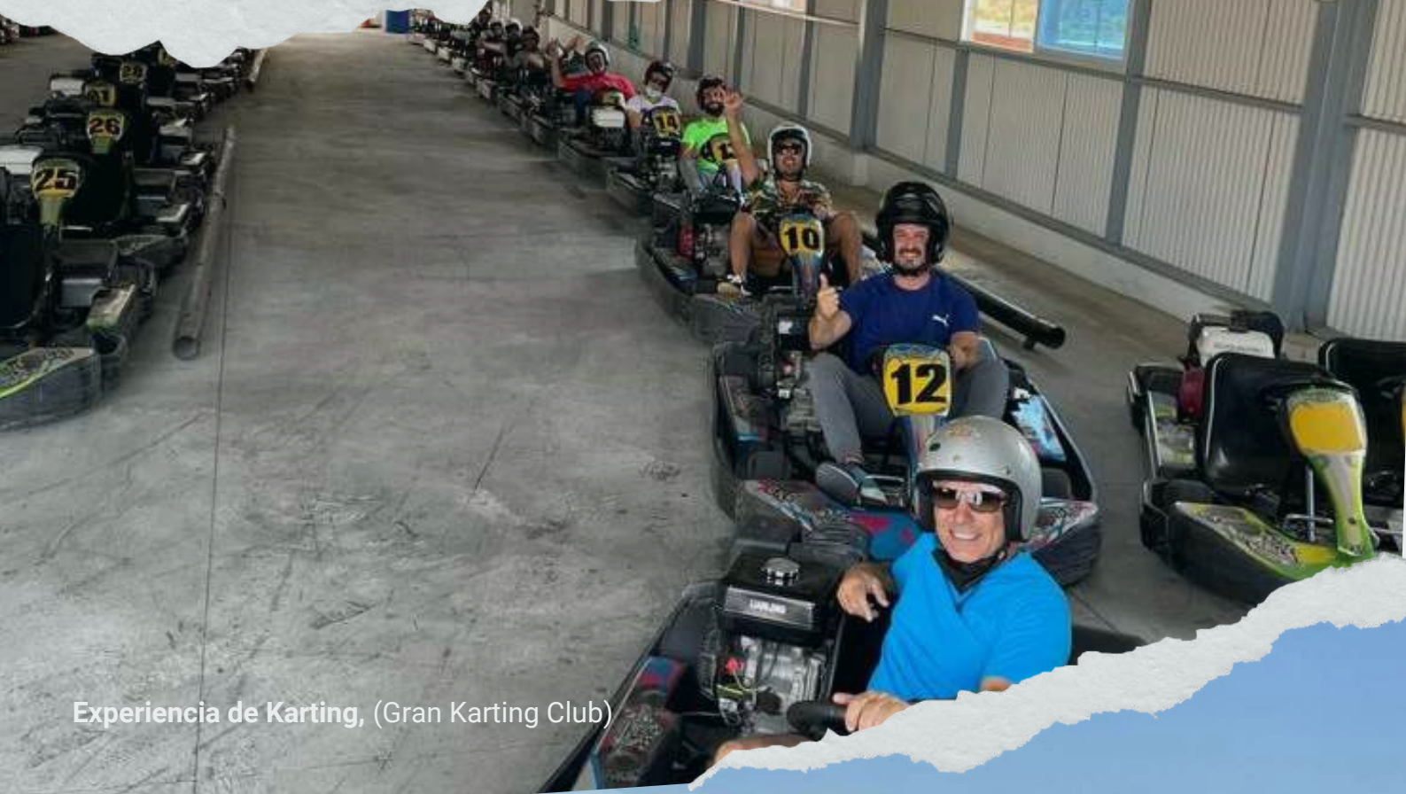
Experiencia de Karting, (Gran Karting Club)