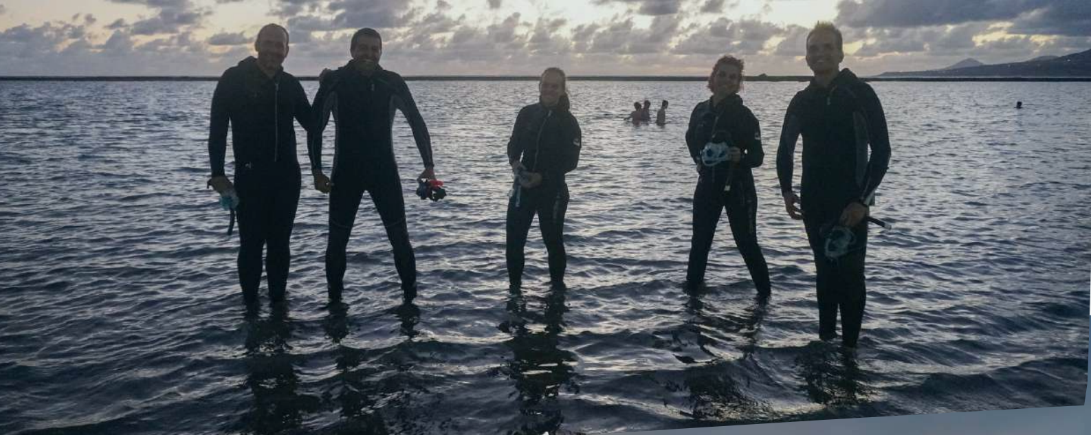
Snorkeling nocturno, (Snorkeling experience)