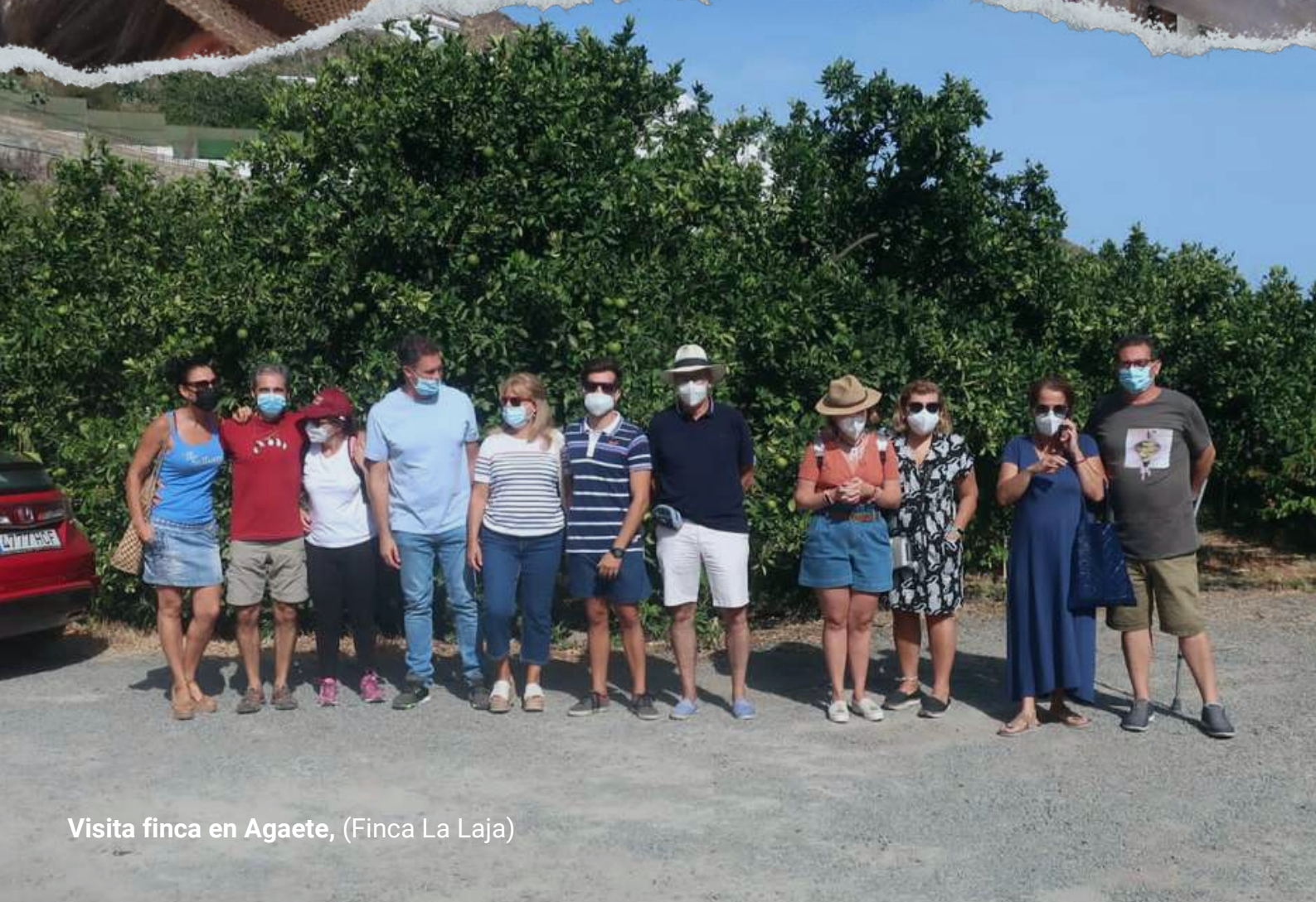
Visita finca en Agaete, (Finca La Laja)