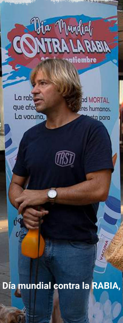
Día mundial contra la RABIA, stand informativo.